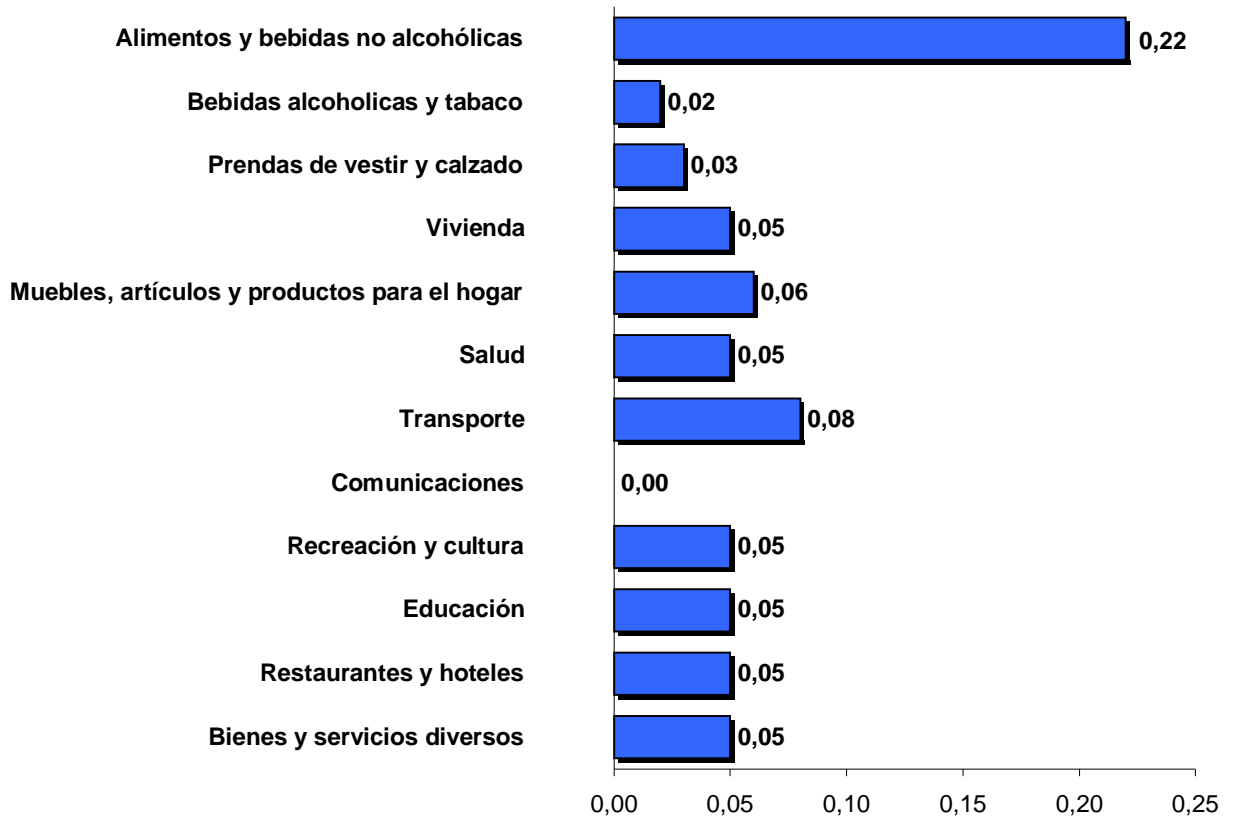
Incidencias según divisiones. Marzo 2015

La suma de las incidencias puede no reproducir exactamente la variación total debido a redondeos